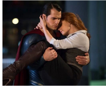
2016 BATMAN vs SUPERMAN (Dawn of Justice) de Zack Snyder avec Henry Cavill