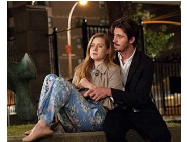
2014 LULLABY (Lullaby) d'Andrew Levitas avec Garrett Hedlund