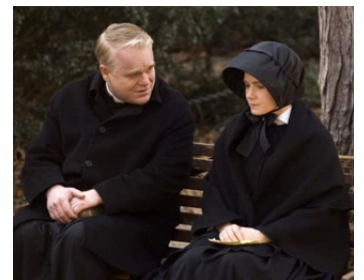
2008 DOUTE (Doubt) de John Patrick Shanley avec Philipp Seymour Hoffman