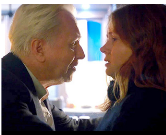
2020 LA FEMME À LA FENÊTRE (The Woman in the Window) de Joe Wright avec Gary Oldman