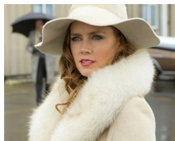
2021 DEAR EVAN HANSEN (Dear Evan Hansen) de Stephen Chbosky