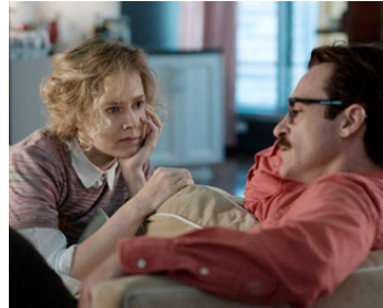
2013 HER (Her) de Spike Jonze avec Joaquin Phoenix