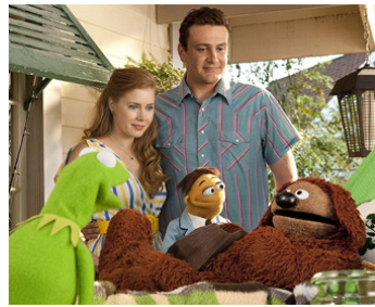
2011 LES MUPPETS, LE RETOUR (The Muppets) de James Bobin avec Jason Segel