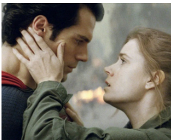
2017 JUSTICE LEAGUE (Justice League) de Zack Snyder avec Henry Cavill