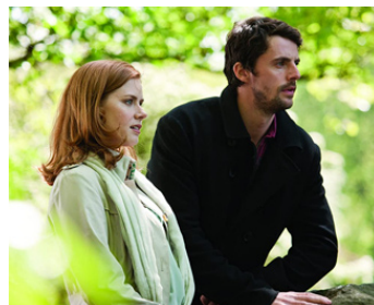
2010 DONNE-MOI TA MAIN (Leap Year) d'Anand Tucker avec Matthew Goode