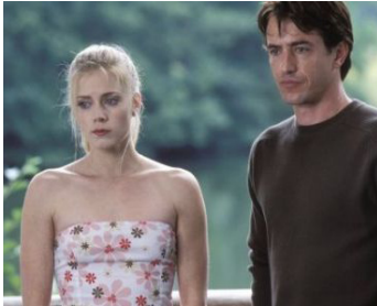
2004 L'ESCORTE (The Wedding Date) de Clare Kilner avec Dermot Mulroney