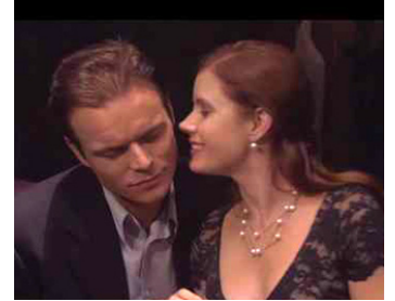
2006 MOONLIGHT SERENADE de Giancarlo Tallarico avec Alec Newman