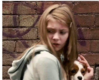
2007 UNDERDOG, CHIEN VOLANT NON IDENTIFIÉ (Underdog) de Frederick Du Chau