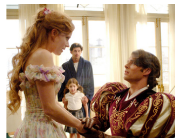
2021 DÉSENCHANTÉE (Desenchantée) d'Adam Shankman avec P. Dinklage, James Marsden