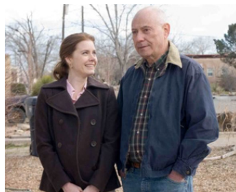
2008 SUNSHINE CLEANING de Christine Jeffs avec Alan Arkin