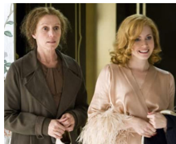
2008 MISS PETTIGREW (Miss Pettigrew lives for a day) de Bharat Nalluri avec Frances McDormand