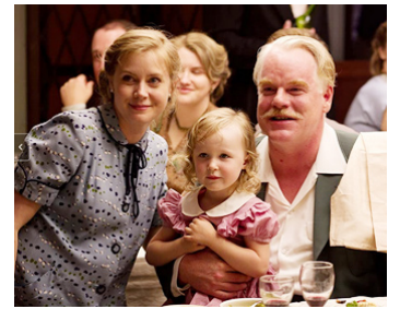
2012 THE MASTER (The Master) de Paul Thomas Anderson avec Philipp Seymour Hoffman