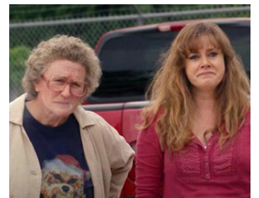
2020 UNE ODE AMÉRICAINE (Hillbilly Elegy) de Ron Howard avec Glenn Close