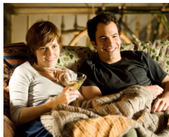
2009 JULIE ET JULIA (Julie & Julia) de Nora Ephron avec Chris Messina