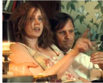
2012 SUR LA ROUTE (On the Road) de Walter Salles avec Viggo Mortensen