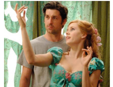
2007 IL ÉTAIT UNE FOIS (Enchanted) de Kevin Lima avec Patrick Dempsey