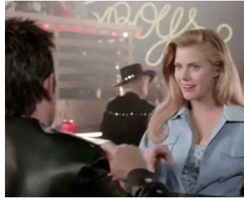
2002 AU SERVICE DE SARA (Serving Sara) de Reginald Hudlin avec Matthew Perry