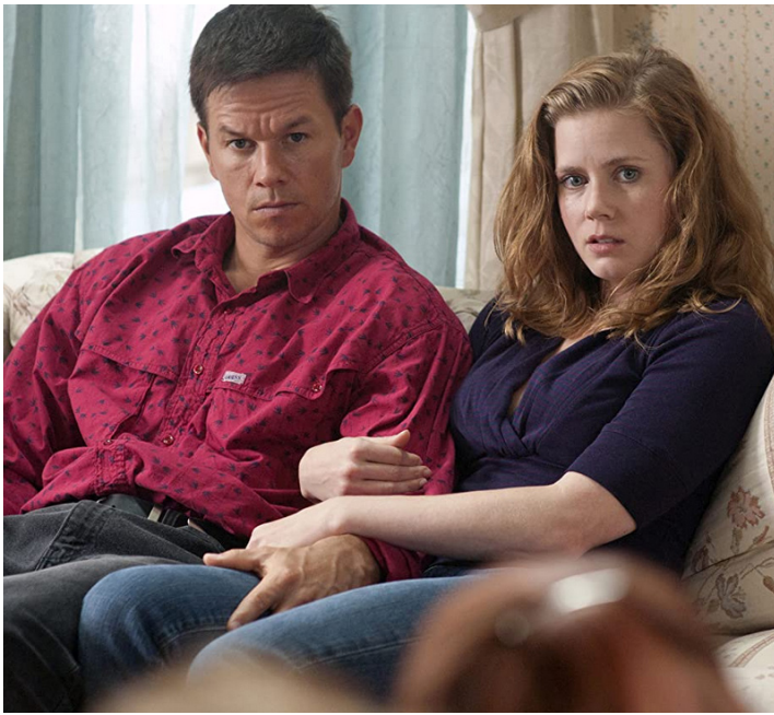
2010 FIGHTER (The Fighter) de David O. Russell avec Mark Wahlberg