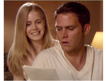
2004 THE LAST RUN (The Last Run) de Jonathan Segel avec Steven Pasquale