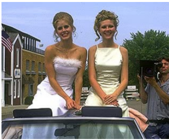
1999 BELLES À MOURIR (Drop Dead Gorgeous) de Michael Patrick Jann avec Kirsten Dunst