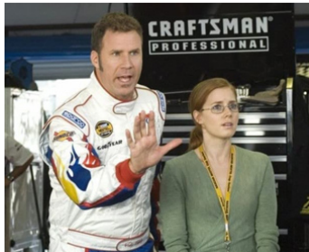
2006 RICKY BOBBY ROI DU CIRCUIT (Talladega Nights) d'Adam McKay avec Will Ferrell