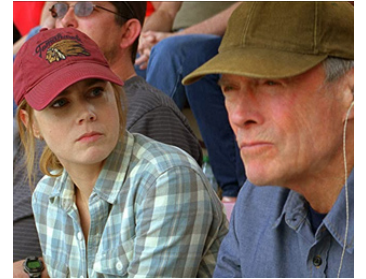
2012 UNE NOUVELLE CHANCE (Trouble with the Curve) de Robert Lorenz avec Clint Eastwood