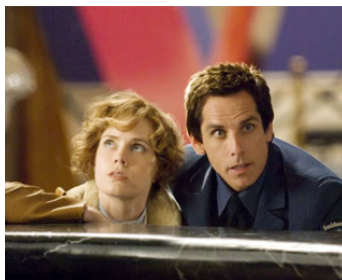
2009 LA NUIT AU MUSÉE 2 (Battle of the Smithsonian) de S. Levy avec Ben Stiller