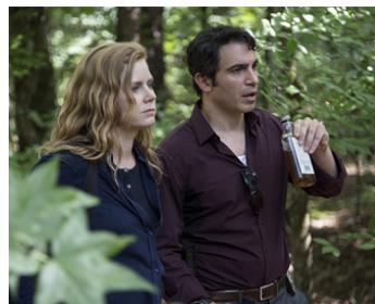
2018 SUR MA PEAU (Sharp Objects, TV) de Jean-Marc Vallée avec Chris Messina