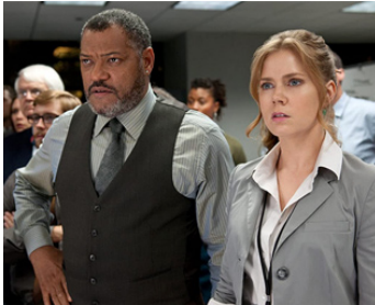
2013 MAN OF STEEL (Man of Steel) de Zack Snyder avec Laurence Fishburne