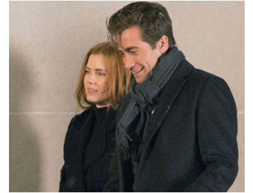
2016 NOCTURNAL ANIMALS (Nocturnal Animals) de Tom Ford avec Jake Gyllenhaal