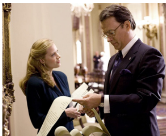
2007 LA GUERRE SELON CHARLIE WILSON (Charlie Wilson's War) de Mike Nichols avec Tom Hanks