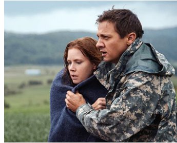
2016 PREMIER CONTACT (Arrival) de Denis Villeneuve avec Jeremy Renner