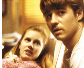
2005 JUNEBUG (Junebug) de Phil Morrison avec Embeth Davidtz